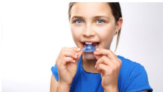
Un traitement orthodontique précoce permet d'anticiper les problèmes dentaires liés aux mauvaises habitudes de l'enfant (suction, respiration buccale...).

– “ Le choix du traitement orthodontique dépendra du but recherché et du souhait du patient. ”